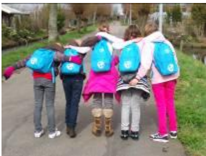
Wandelen voor Water (groep 7)