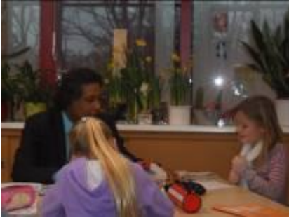
De inspecteur bezoekt o.a. groep 6