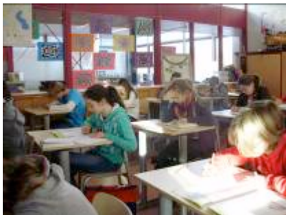
Leerlingen van groep 8 oefenen voor de cito.